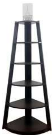
Витрина (открытая) Bernard CASSIÈRE