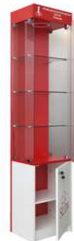
Витрина (закрытая) SÜDA