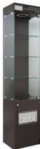
Витрина (закрытая) Bernard CASSIÈRE